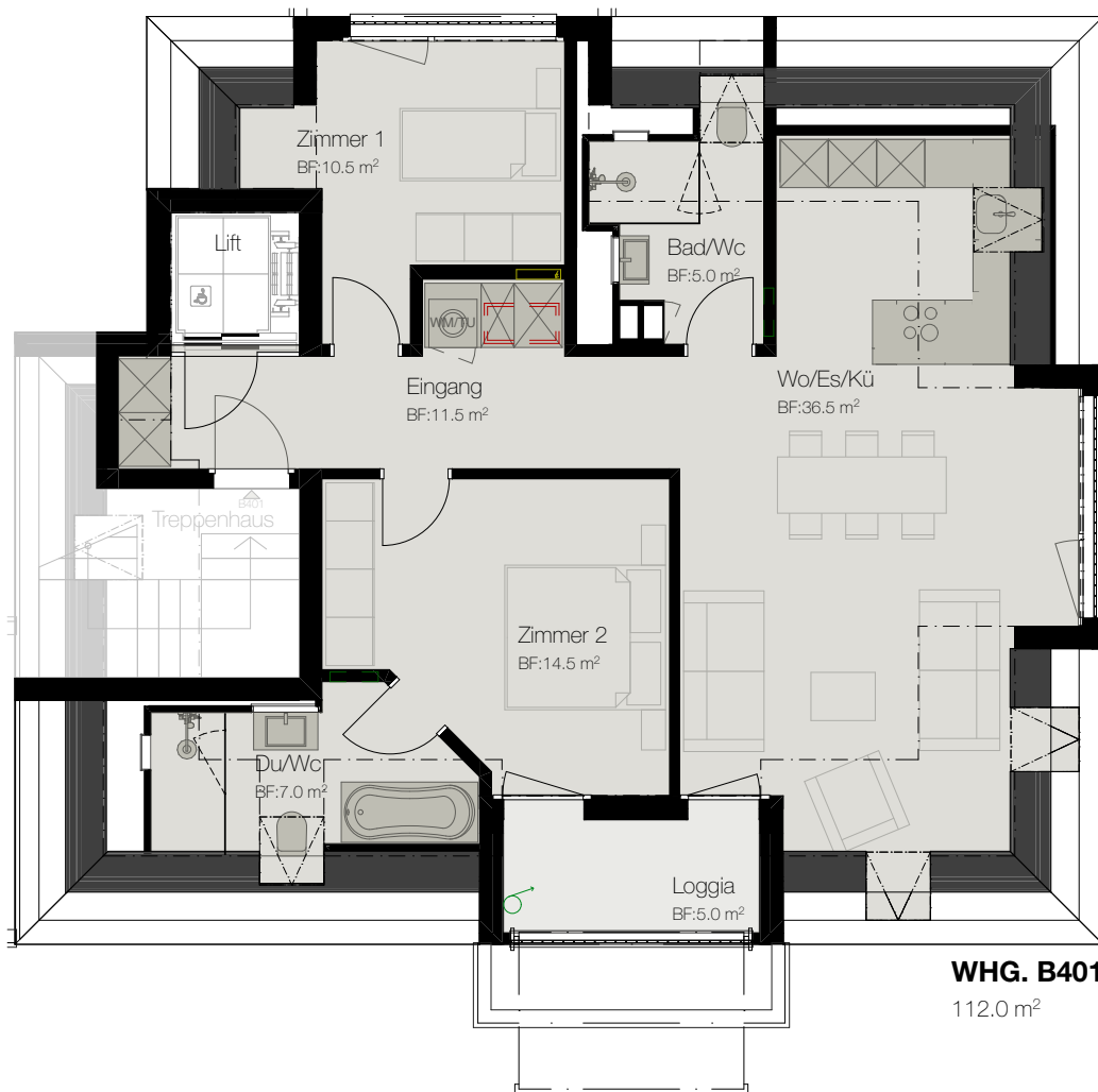
WHG. B401 112.0 m 2